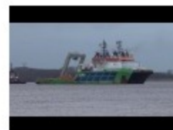
Maniobra de reflotamiento del 19.000 TEU, CSL INDIAN OCEAN