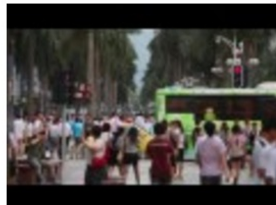
LA OMI CON LAS MUJERES DEL MUNDO MARÍTIMO